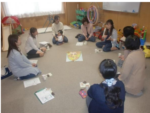
きつおんカフェ（吃音保護者会）

通級児の笑顔が、私たちにとっては何よりの元気の素…。着実にことばの力を伸ばすと共に、子どもたちや保護者にとって、ほっとできるような心の居場所となるようにしていきたいと思っています。