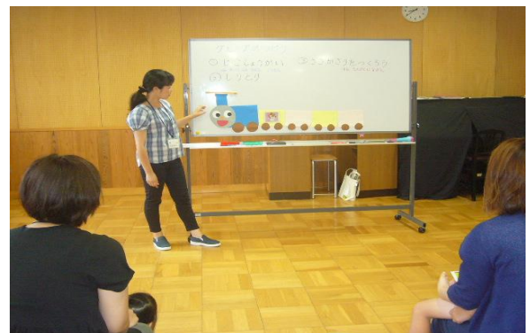
グループ指導（しりとり列車）