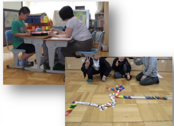
個別の指導・グループ指導

LD通級には、下記の障害に留まらず、様々な悩みを抱えた児童や保護者が集まってきます。そのため、年間2回の個別面談や保護者交流会を行い、支援に努めています。他に在籍校訪問を行い、学級担任と指導目標や指導方法について話し合いを行っています。