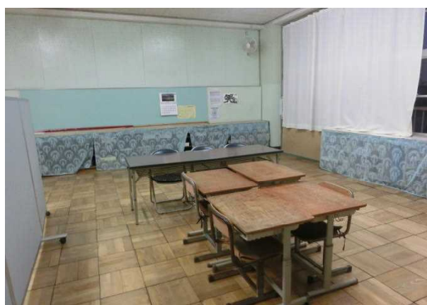
指導用の机と、保護者席（長テーブル） 教材は、レースカーテンの奥の棚

ひまわり教室に通ってくる児童にとって「楽しくほっとできる場所」であり、「できるようにになりたい」「困っている状態をなんとかしたい」という思いに答えていきたいと考えています。